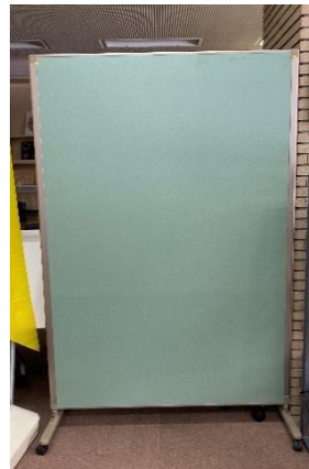
衝立 120×180 cm 画鋸、テープ貼り付け可