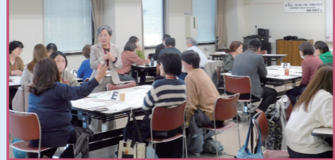
「多様な学びの場づくりを探る講座」の様子

◆地域キャンパス講座◆ 「多様な学びの場づくりを探る講座」 (令和5~6年度)を受講 元不登校の当事者の親として不登校や生きづらさを感じている子どもたちの安心できる居場所を増やしたいという思いで、2か年にわたり開催された県民カレッジ地域キャンパス講座「多様な学びの場づくりを探る講座」に参加しました。 講座では、オルタナティブスクール、定時制高校、夜間中学など、多様な学びの場それぞれの特徴について詳しく学ぶことができました。また、グループワークでは、不登校が増えている要因や公教育の行き詰まり、学校や福祉の分野との連携の難しさなど様々な角度からの意見交換ができました。そして、学ぶことはどんな人にも与えられた権利であるということ、学びと居場所の大切さを共有できました。特に「自主夜間中学」には学びへの強い情熱と学びの自由度があること、学びたい人が一人でもいてそれを支える人がいれば、すぐにもつくる事ができることも知りました。