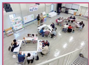
自主夜間中学「あおも・リラ」の様子

こうして、講座後の事務局からの働きかけもあり、今年2月、本県初の自主夜間中学「あおも・リラ」を立ち上げることにしました。運営スタッフとして常に心がけているのは、学びの伴走者として、過度になりすぎないコミュニケーションと配慮を忘れず、利用者さんの学びたいという思いを尊重し、安心できる居場所とするための環境づくりです。 学びたいという思い一点で集まる「あおも・リラ」の利用者さんの姿はともまぶしく、様々な事情や背景がありながらも、学びたいことを自分で選択し、自分のペースで学び、それを継続できていることが素晴らしいと感じています。また、世代の違う利用者の皆さんが、同じ空間で学ぶことも、学びへの意欲の刺激となっていて共感に感じます。世代を超えて共にレクや会食をすることで、新たな関係性が生まれていることから、人との関わりを持つことの大切さを学んでいます。こうした関わり方ができるのも、「多様な学びの場づくりを探る講座」を受講したからだと思います。