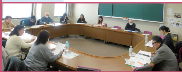
「ドゥ(もっと)韓国に詳しくなろう!講座」の様子

◆ボランティア講師による自主講座◆ 「チョックンマン(少しだけ)韓国に詳しくなろう講座」 「ドゥ(もっと)韓国に詳しくなろう講座」(令和6年度)を受講 韓国に少し興味があったので、県総合社会教育センターでチラシを見つけて参加してみました。前半の講座では、最初はハンブルで自分の名前を書いたり、時間や物の数え方を覚えたりしましたが、なかなか難しかったというのが正直なところですが、最後の30分は、韓国の文化や見どころについて、講師やコーディネーターである市の国際交流員の先生や留学生の話聞いて、面白く感じ、興味が沸きました。2回目の講座では、映画やドラマなどが話題になりました。その中で朝鮮王朝の王を取り上げた映画や有名俳優の恋愛ドラマに興味をもち、DVDを借りて鑑賞し、それだけでは飽き足らず、現代の韓国を風刺した映画を鑑賞するために映画館へ出かけたりもしました。講座では、自分の好きなドラマの名場面を解説しながら、映像でみなさんに紹介しました。